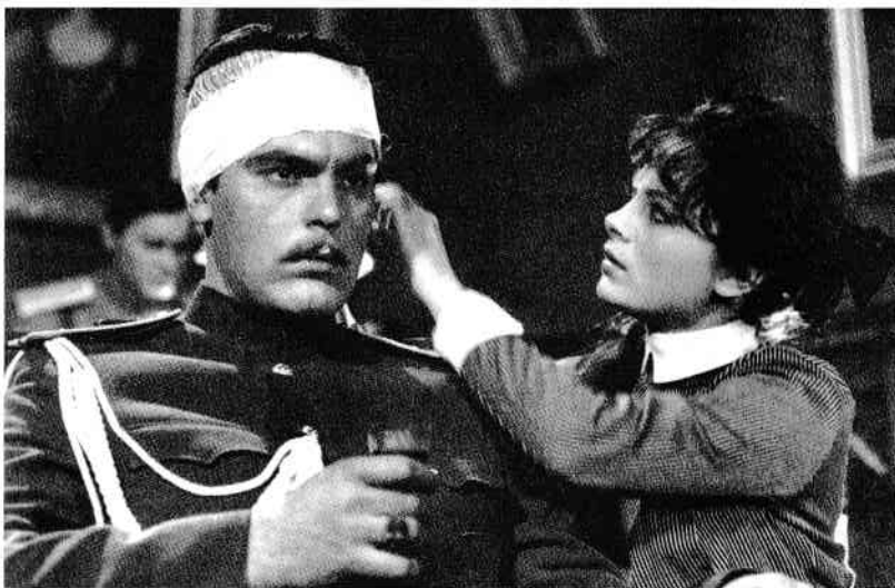
Secvențe din filmele Vreau să vă văd (turnat la Studioul DEFA din Republica Democratică Germania), Serghei Lazo și Ciudatul (Studioul Azerfilm, Baku).