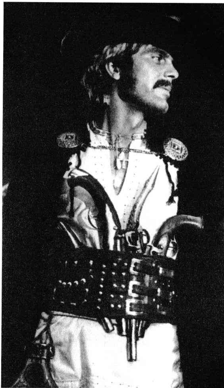
În rolul lui Radu Negostin din filmul Lăutarii .

Am schimbat câteva vorbe de complezență și de acum îmi luam rămas bun, când el îmi propuse să-l aștept până se des-curcă cu „hârbul” lui și apoi mă va rezezi până la Colonița, dar mai întâi să trecem pe la vila sa din Tohatinul de Jos. Acestui loc, în copilărie, noi îi ziceam Valea Vătavului. În